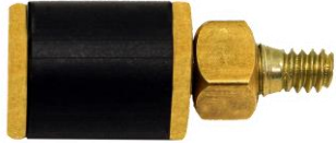
Dispositivo de Suspensão OB Para Tubulação 1/2" - 3/4" - 1" - Encaixe / Porca Quadrada Ponta Macho (Rosca Externa)